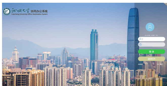
聊城大学协同办公平台